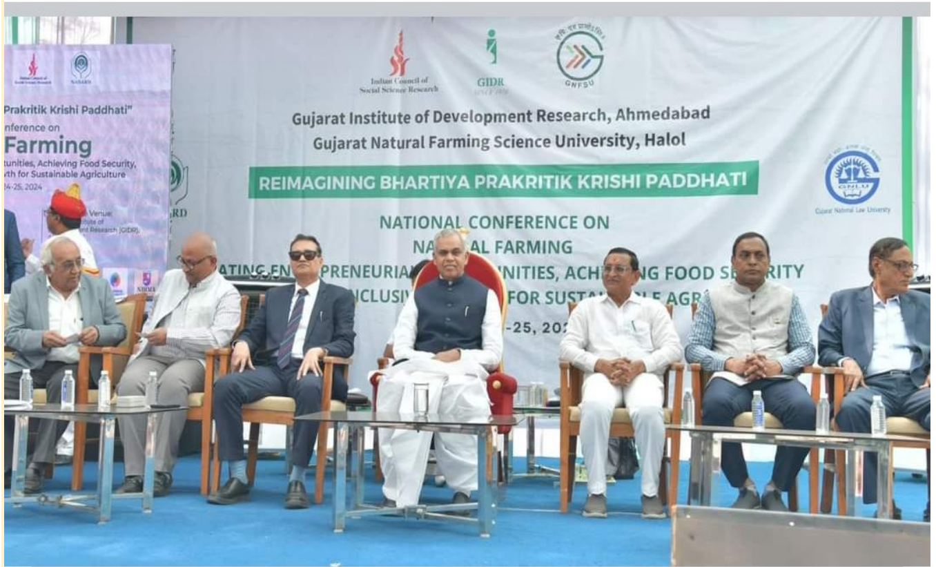
Day -1 Inauguration session